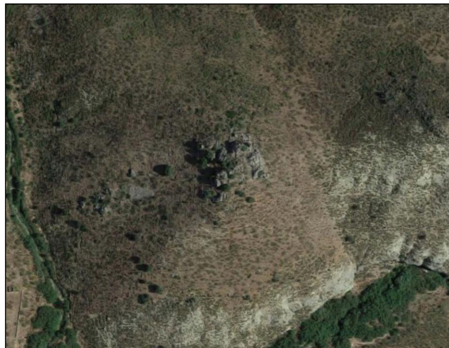
Vista aérea y localización del Yacimiento de "Los Baldios"